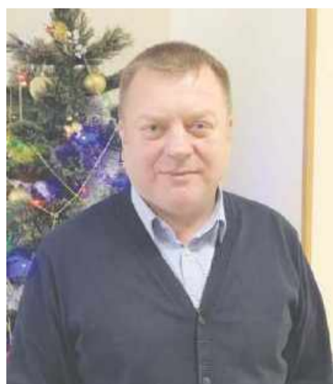
Уважаемые жители района Выхино-Жулебино!

Примите самые искренние поздравления с наступающим Новым годом и Рождеством!