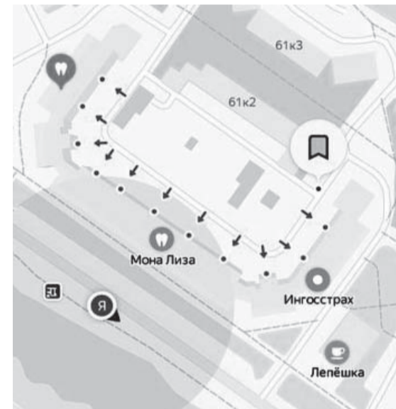
СХЕМА РАЗМЕЩЕНИЯ ЦВЕТЧОГО ВАЗОНА ПО АДРЕСУ: УЛ. ПРИВОЛЬНАЯ, Д. 61, КОРП. 1

Приложение к решению Совета депутатов муниципального округа Выхино-Жулебино от 17.12.2019г. № 118