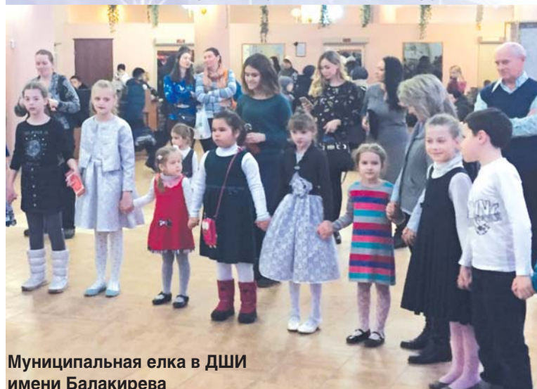
Муниципальная елка в ДШИ имени Балакирева