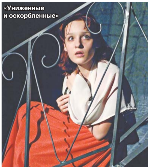
«Униженные и оскорбленные»

– Театр сейчас развивается очень стремительно. Он становится все больше синтетическим. Если раньше в музыкальном театре артисты