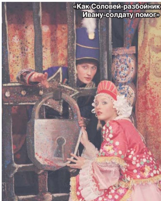
«Как Соловей-разбойник Ивану-солдату помог»