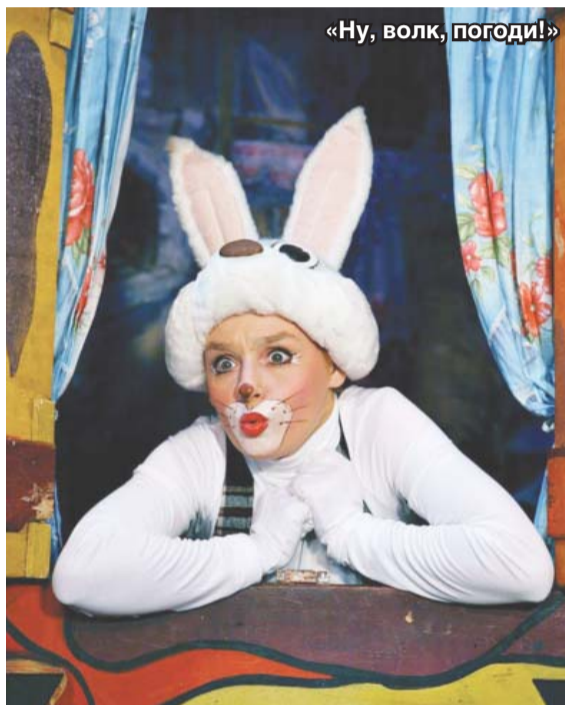
«Ну, волк, погоди!»

Беседу вела Дарья АНОХИНА