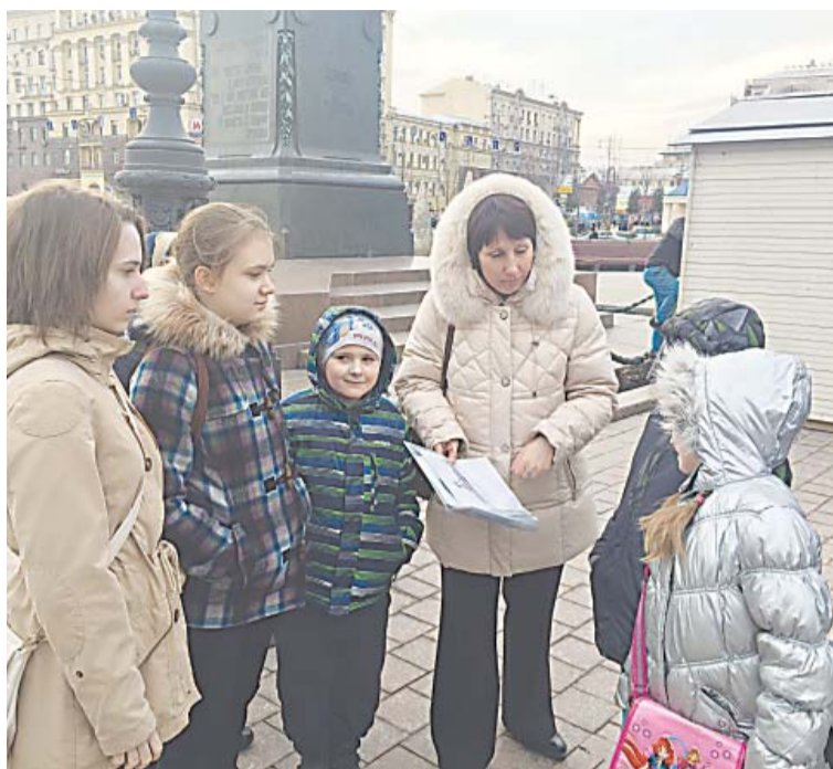
Юные экскурсоводы у памятника Пушкину