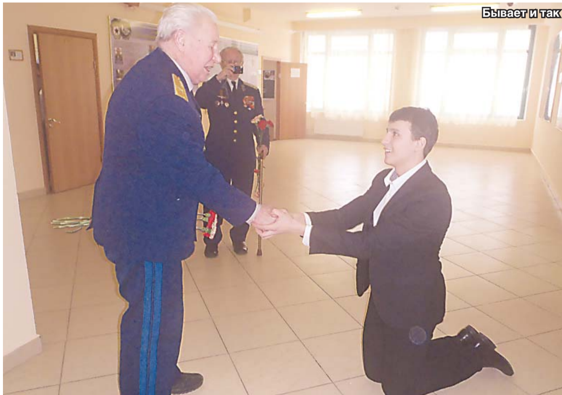
Бывает и так