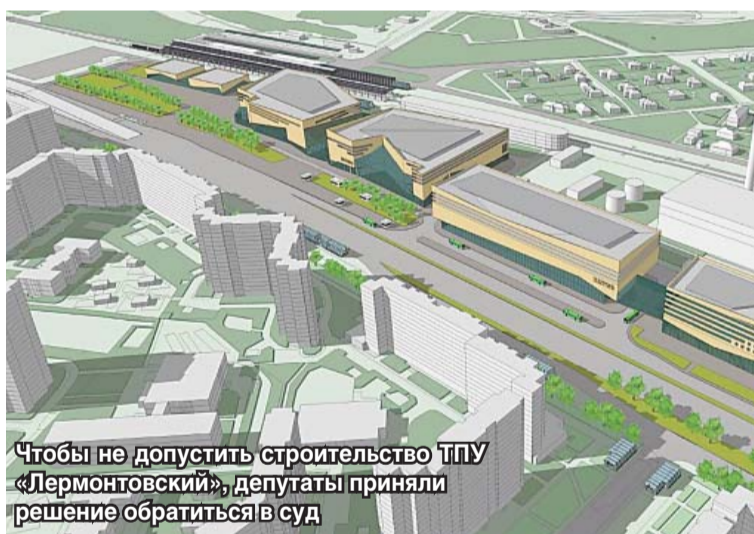
Чтобы не допустить строительство ТПУ «Лермонтовский», депутаты приняли решение обратиться в суд

депутаты единогласно проголосовали «за».