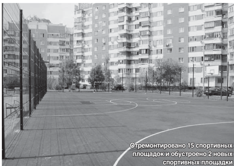
Отремонтировано 15 спортивных площадок и обустроено 2 новых спортивных площадки

Совместно с муниципалитетом управа района многое делает для того, чтобы у наших детей была возможность интересно и с пользой для здоровья отдыхать. Всего в летний период на средства бюджета города Москвы Департаментом семейной и молодежной политики через управу организован отдых 418 детей из семей льготных категорий. На базе летних городских лагерей школ и Центров социального обслуживания отдохнуло 805 детей. Семейным отдыхом охвачено 76 семей (133 ребенка), на семейные экскурсии отправлено 8 семей (13 детей).