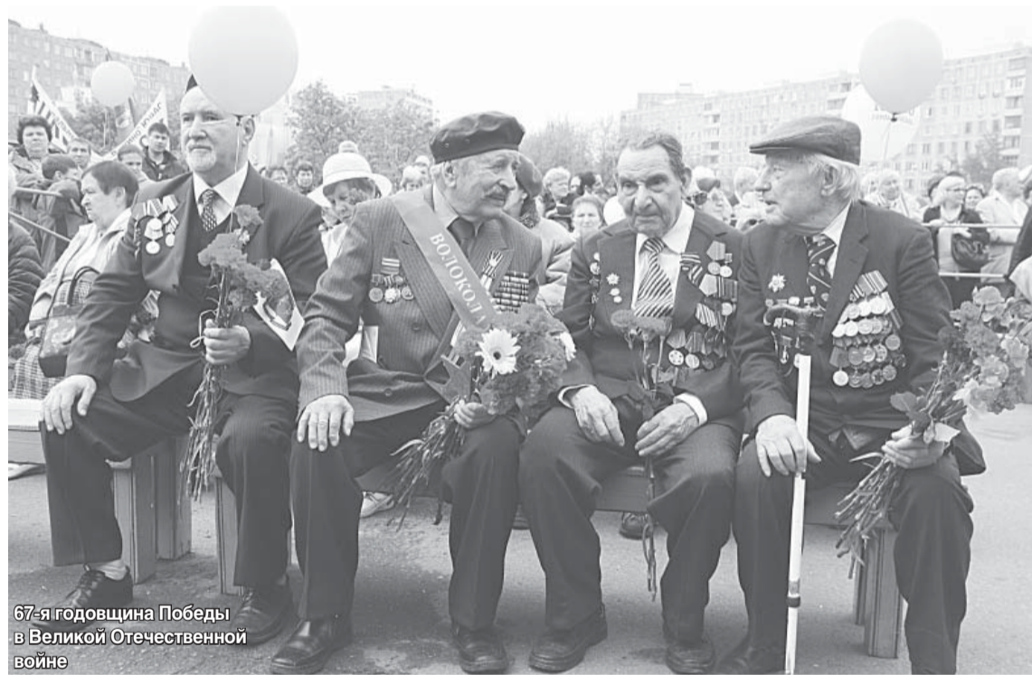
67-я годовщина Победы в Великой Отечественной войне

организованных в ТСЖ, работают общественные советы, институт старших по домам и подъездам. Каждые две недели в помещении ГУИС «Жулебино», ГУИС «Выхино» при участии руководителей управы, ГУИС, ДЕЗ района, подрядных организаций проводятся заседания Ассоциации старших по домам для совместного решения социальных проблем в жилищной сфере, осуществления общественного контроля за содержанием, технической эксплуатацией и ремонтом жилых домов, а также содержанием придомовых территорий, объектов благоустройства и озеленения.