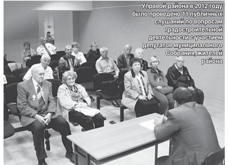
Управой района в 2012 году было проведено 11 публичных слушаний по вопросам градостроительной деятельности с участием депутатов муниципального Собрания, жителей района

выступлений они подчеркнули, что в районе главой ведется огромная работа, и необязательно ходить на митинги и светиться в СМИ, чтобы быть ближе к народу. А если у депутатов есть вопросы по работе главы, то надо спросить себя: в чем не доработали, не поддерживали главу? Депутаты приняли