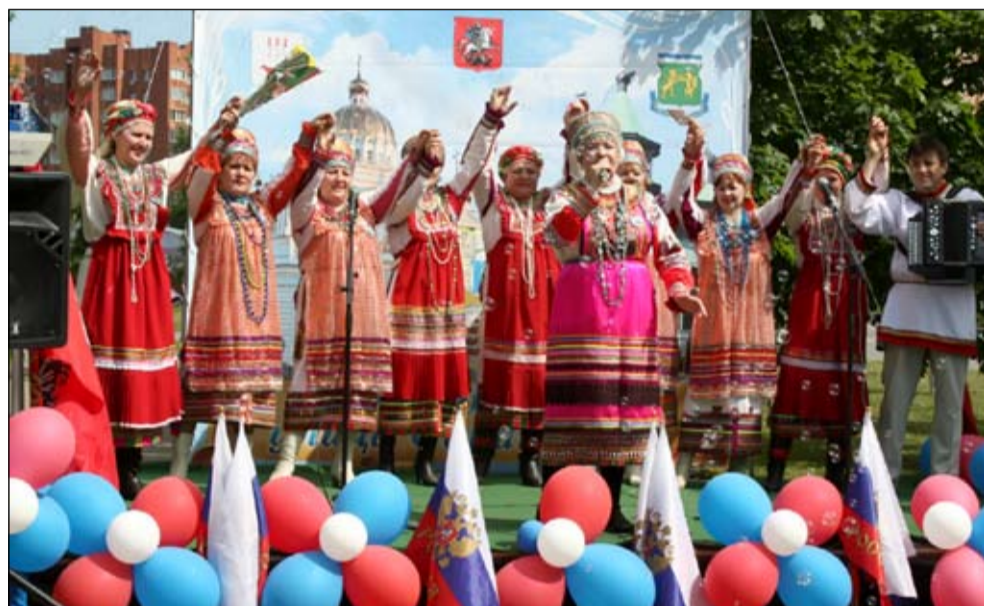
Вот и Саранск – один из старейших русских городов