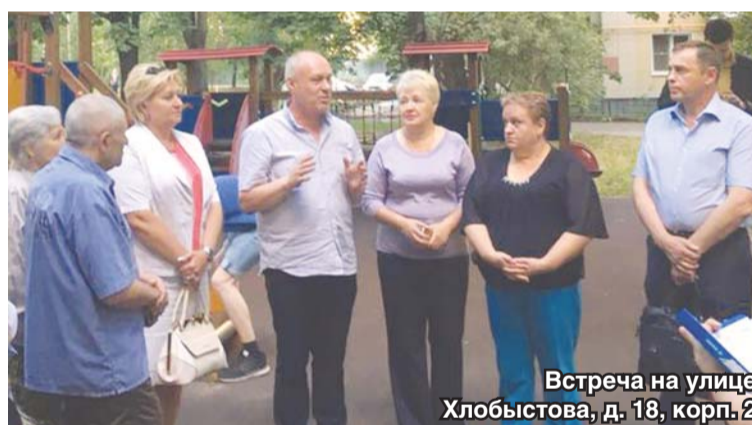
Встреча на улице Хлобыстова, д. 18, корп. 2