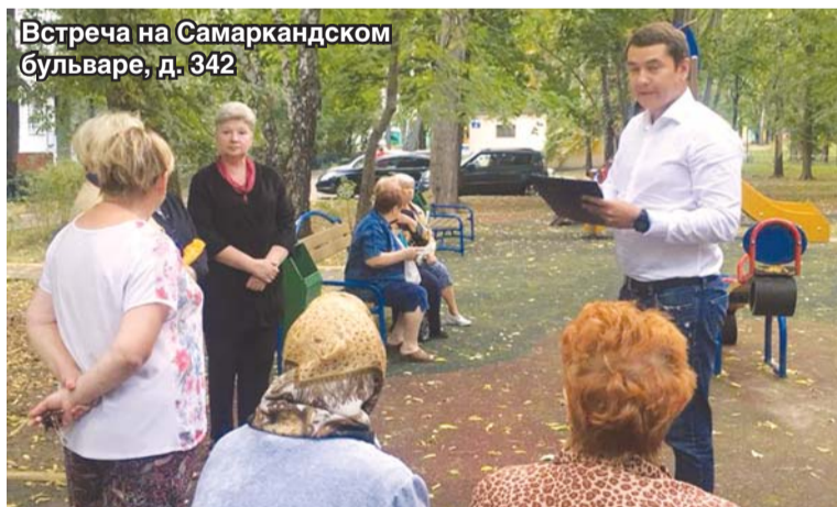
Встреча на Самаркандском бульваре, д. 342