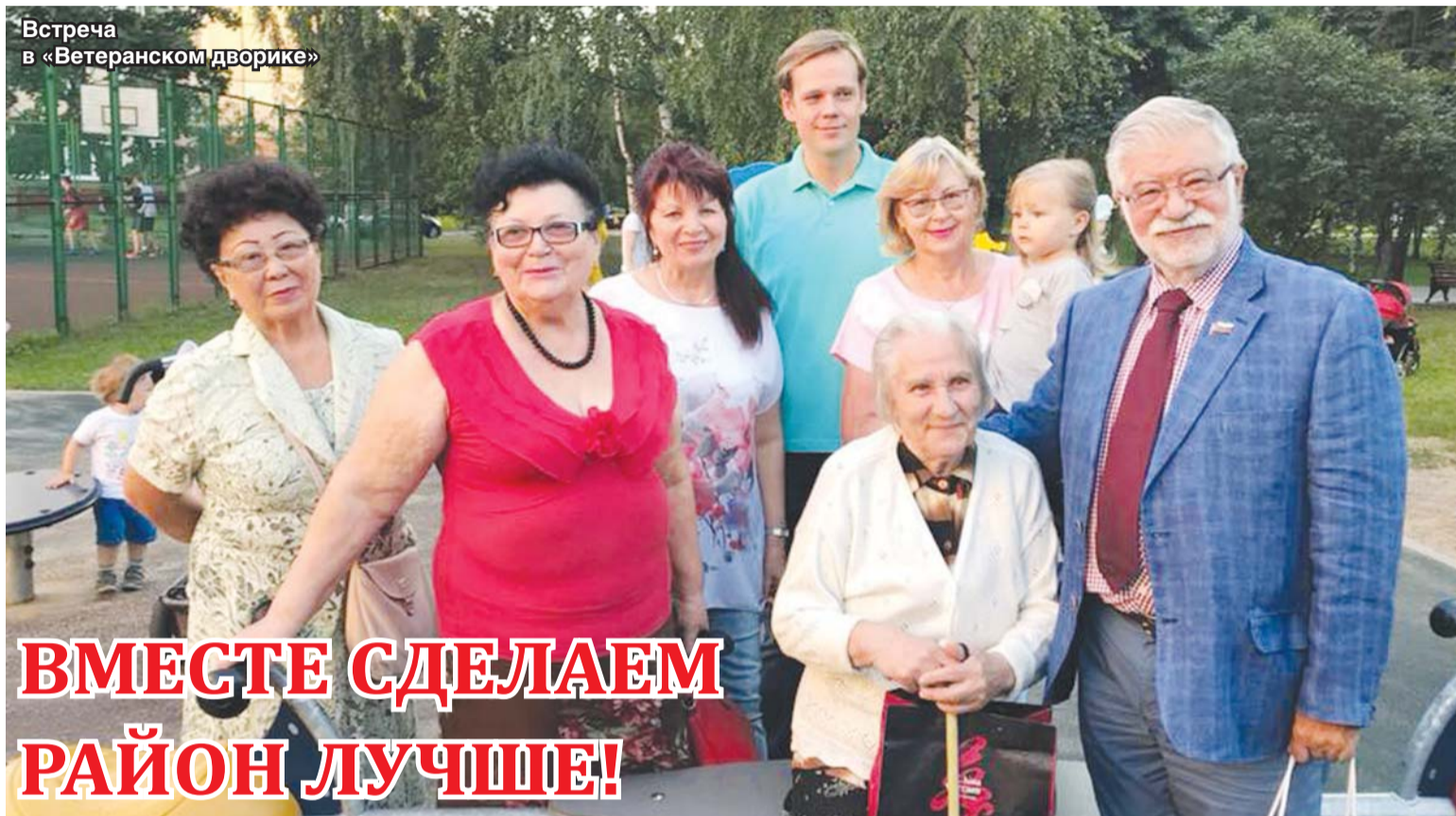
Встреча в «Ветеранском дворе»

В течение всего августа почти в ежедневном режиме проходили встречи муниципальных депутатов с жителями района Выхино-Жулебино. На ставших уже привычными встречах обсуждались насущные проблемы – капитальные ремонты, качество уборки придомовой территории и подъездов, вопросы ЖКХ, благоустройства, озеленения и многое другое, что волнует неравнодушных горожан. Все озвученные на встречах проблемы взяты под особый контроль.