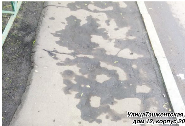
Улица Ташкентская, дом 12, корпус 20