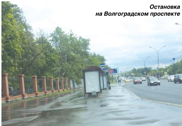
Остановка на Волгоградском проспекте

Галина Григорьевна Радионова и жители первого подъезда дома 25, корпус 1, на Ташкент-