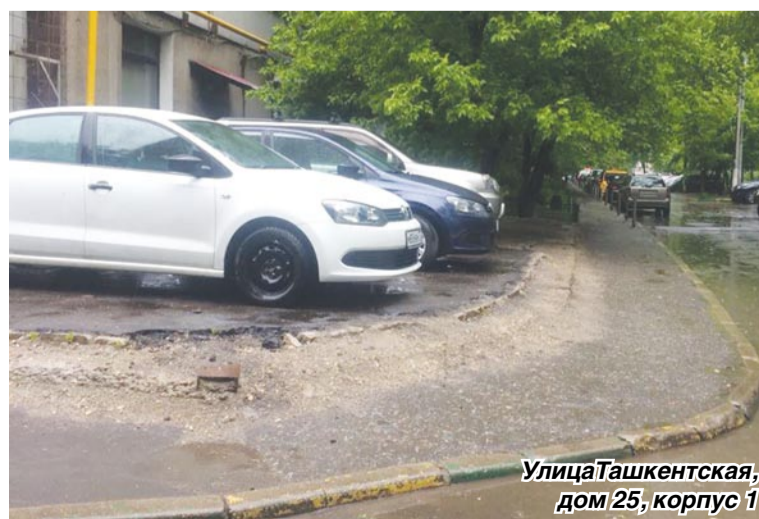
Улица Ташкентская, дом 25, корпус 1