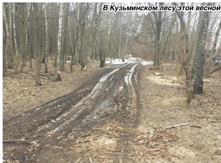
В Кузьминском лесу этой весной

Очень много обращений от жителей по Кузьминскому лесу. Весной всполошилась ветеранская организация ПО-9: «Помогите! В лесу ездят грузовики, деревья вырубают!» К счастью, оказалось, что это была санитарная вырубка.