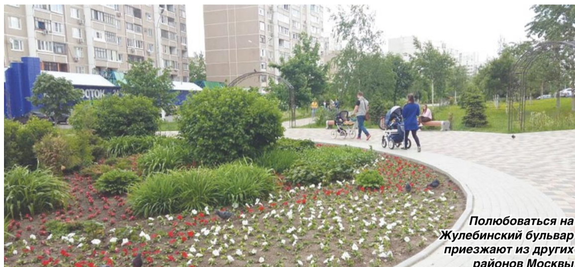
Поллюбоваться на Жулебинский бульвар приезжают из других районов Москвы

В этом году запланированы большие работы в 1-м и 2-м микрорайонах в пешеходной