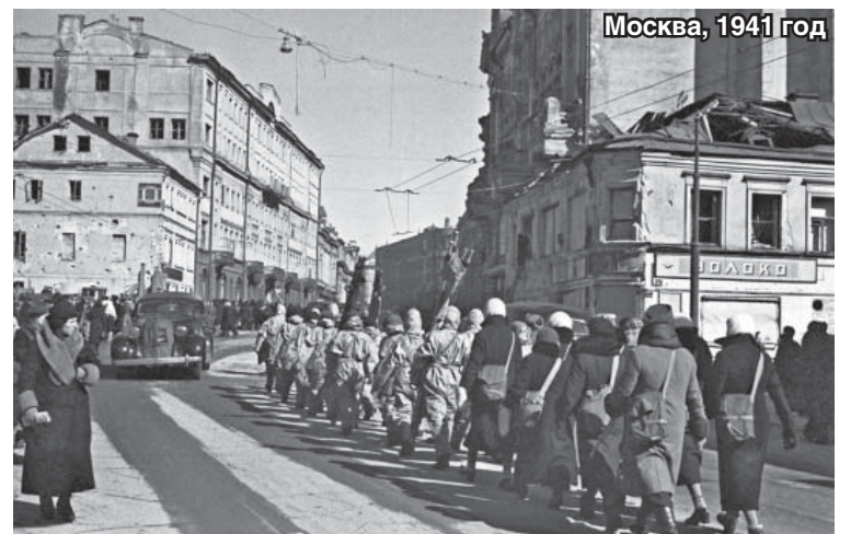
Москва, 1941 год

– А как сложилась Ваша жизнь, как получилось, что Вы попали в науку?