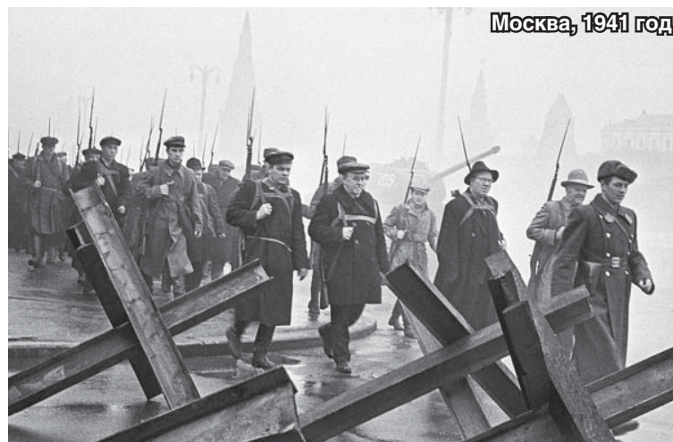
Москва, 1941 год