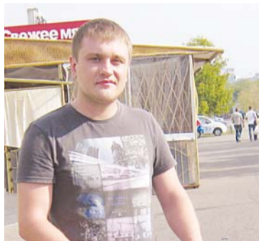
Владимир, ул. Генерала Кузнецова, дом 14:

Вряд ли кто сейчас станет отрицать роль спорта в нашей жизни. Даже в погоне за хлебом насущным граждане не забывают о том, чтобы поддерживать себя в тонусе: играют в баскетбол и волейбол, катаются на лыжах и коньках, занимаются ездой на велосипеде, бегают трусцой в ближайший лес. В канун Дня физкультурника мы решили спросить самих жителей нашего района, насколько близка им фраза: «Спорт и я».