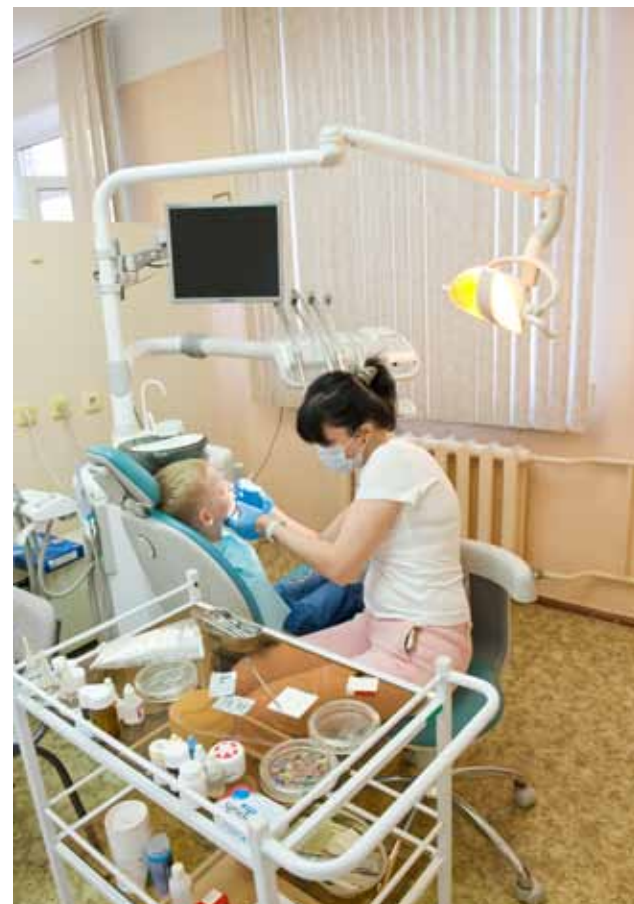
На приеме у детского стоматолога совсем не страшно

- В том случае, если для лечения пациента необходимы дополнительные сложные обследования или дополнительные консультации, любой пациент, прикрепленный на медицинское обслуживание к филиалу, может быть направлен врачом первого уровня (филиала) на консультацию к врачам-специалистам или обследование на второй уровень (головное учреждение – ДГП №143). Если же по результатам обследования пациента на первых двух уровнях оказания медицинской помощи принимается решение о его госпитализации, пациент может быть направлен в стационары, научно-практические центры или иные спе-