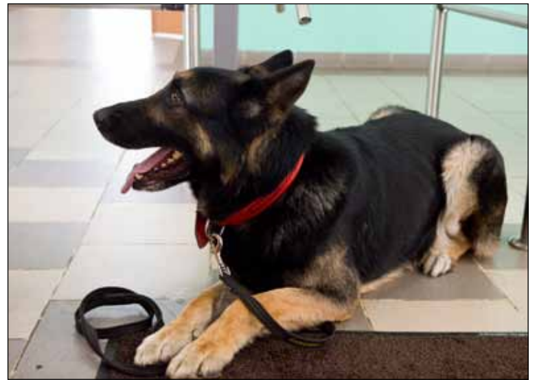
Схема работы проста: собаки обходят школьные холлы и с особой тщательностью проверяют актовый и спортивные залы, ведь именно здесь проходят все основные мероприятия праздника прощания со школьными партами.

Плановая проверка школ прошла в Выхино-Жулебино. Несколько дней подряд сотрудники полиции со специально обученными собаками объезжали школы, чтобы убедиться в безопасности выпускников.