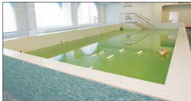
Занятия лечебной физкультурой проводятся, в том числе, и в бассейне

В прошлом году было увеличено количество врачей-специалистов, что позволило сформировать второй уровень оказания медицинской помощи. Приняты на работу