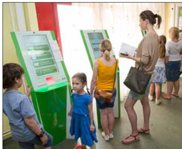
...В порядке электронной очереди

Первый уровень - амбулаторно-поликлинические учреждения, оказывающие первичную доврачебную медико-санитарную помощь, первичную врачебную медико-санитарную помощь и некоторые наиболее востребованные виды первичной специализированной медико-санитарной помощи (филиалы №1, №2, №3, №4, ГБУЗ «ДГП №143 ДЗМ») по следующим специальностям: детская кардио-